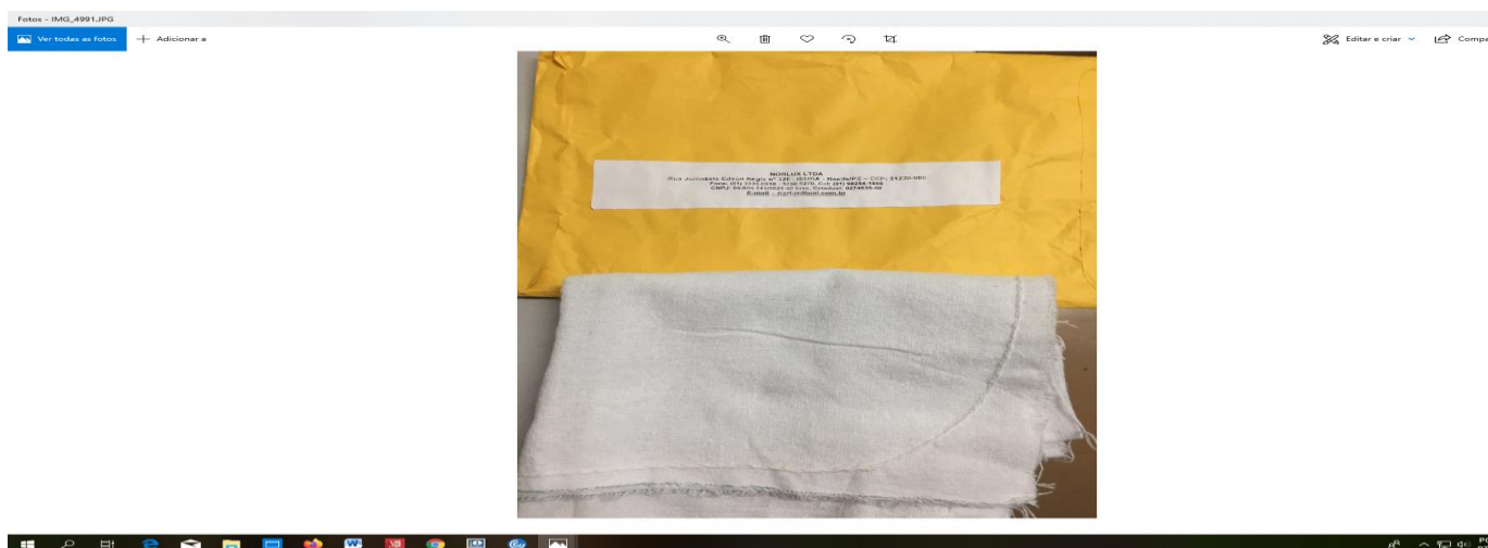
Figura n. 01 - Amostra NORLUX LTDA recebida em 04/03/2020 – sem etiqueta de marca na amostra.