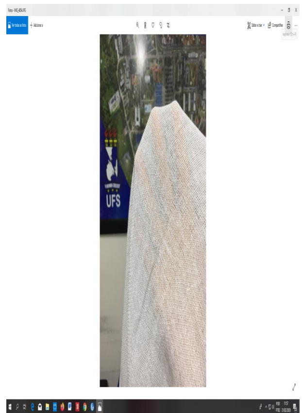
Figura n. 03 – Qualidade do tecido: Tecido com trama de algodão mais fechada (à esquerda) do que a amostra da empresa G C C COMERCIAL (à direita), absorção de umidade boa, o tecido consegue reter açúcar em seu interior. Peso aproximado de 200g.