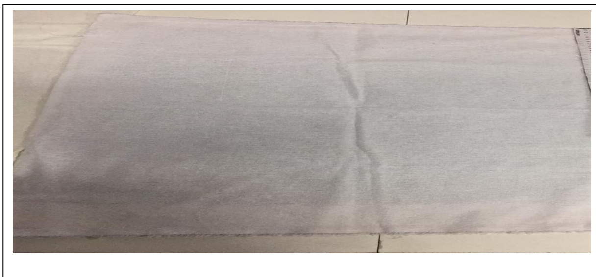
Figura n. 02 – Dimensões NORLUX: 45cm x 68cm , considerando as costuras