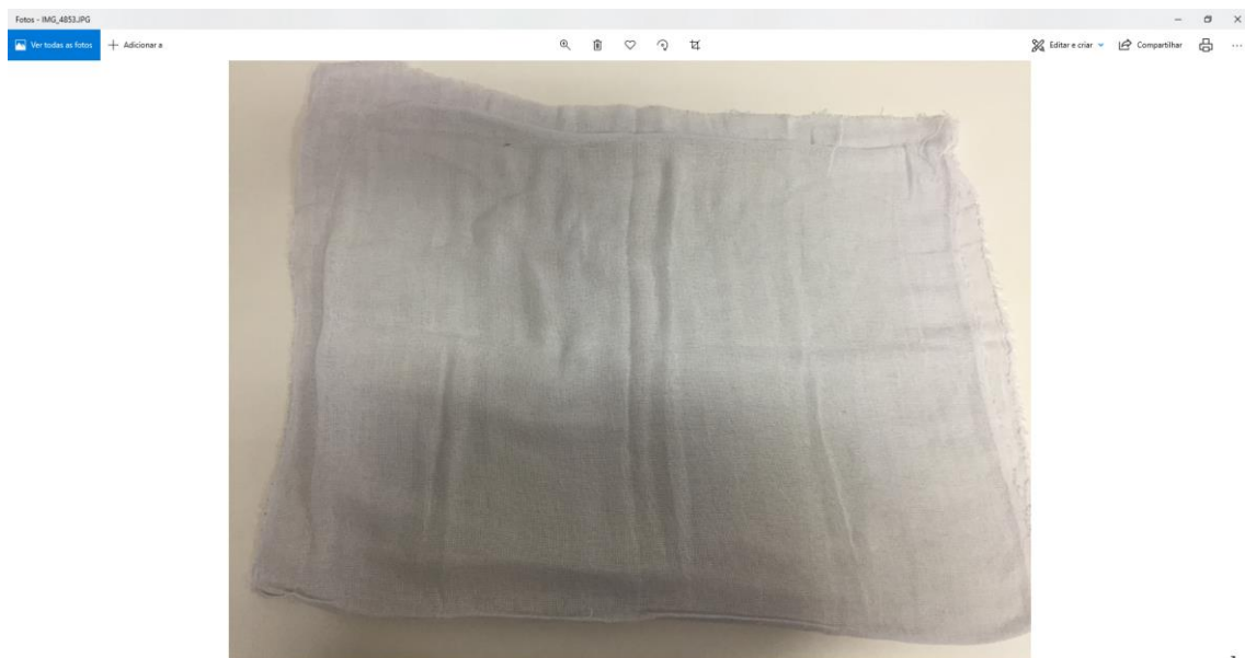
Figura n. 02 – Dimensões GCC: 53,5CM X 68CM, considerando as costuras laterais.