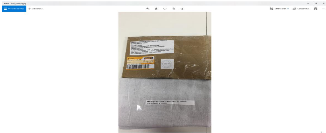
Figura n. 01 - Amostra G C C COMERCIAL recebida em 21/02/2020 – sem etiqueta de marca na amostra.