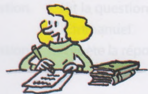
faire un devoir