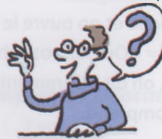
poser une question